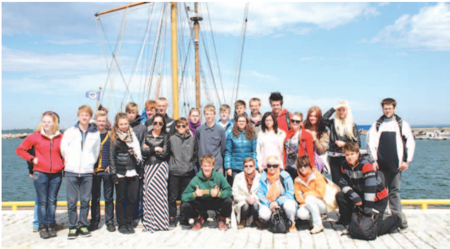
Loo koolinoored ja õpetajad ühispildil enne Kajsamoorige astumist.