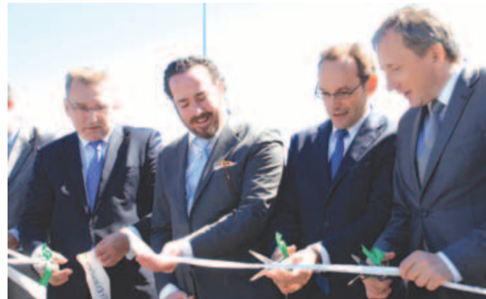
Linti lõikavad minister, CNIM esindaja, prantsuse suursaadik ja Eesti Energia juht.

Avamisel osalesid majandus- ja kommunikatsiooniminister Juhan Parts, Prant-