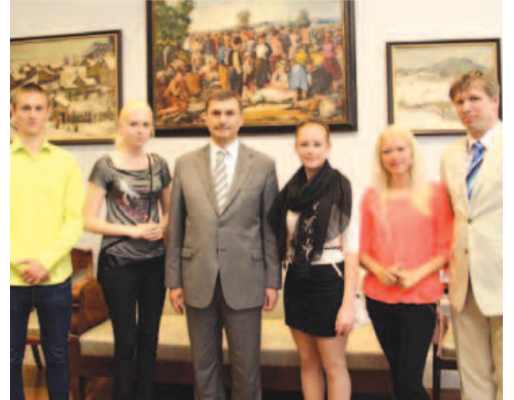
Peaminister võõrustas Loo kooli õpilasfirmat.

Peaminister näitas õpilastele oma ametiruume ja soovitas vaadata filmi "Forrest Gump", et õpilased teaksid, et kui nad tee- vad midagi põhjalikult, siis elu