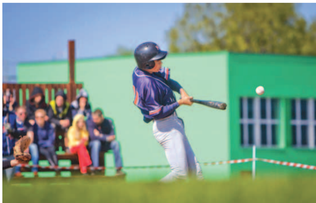
Lätlastest pesapallurid andsid endist parima.

Vapratel lätlastel oleks pidanud koheselt algama teine mäng jutti, aga nende õnneks või õnnetuseks ei olnud vastased veel kohale jõudnud. Peale