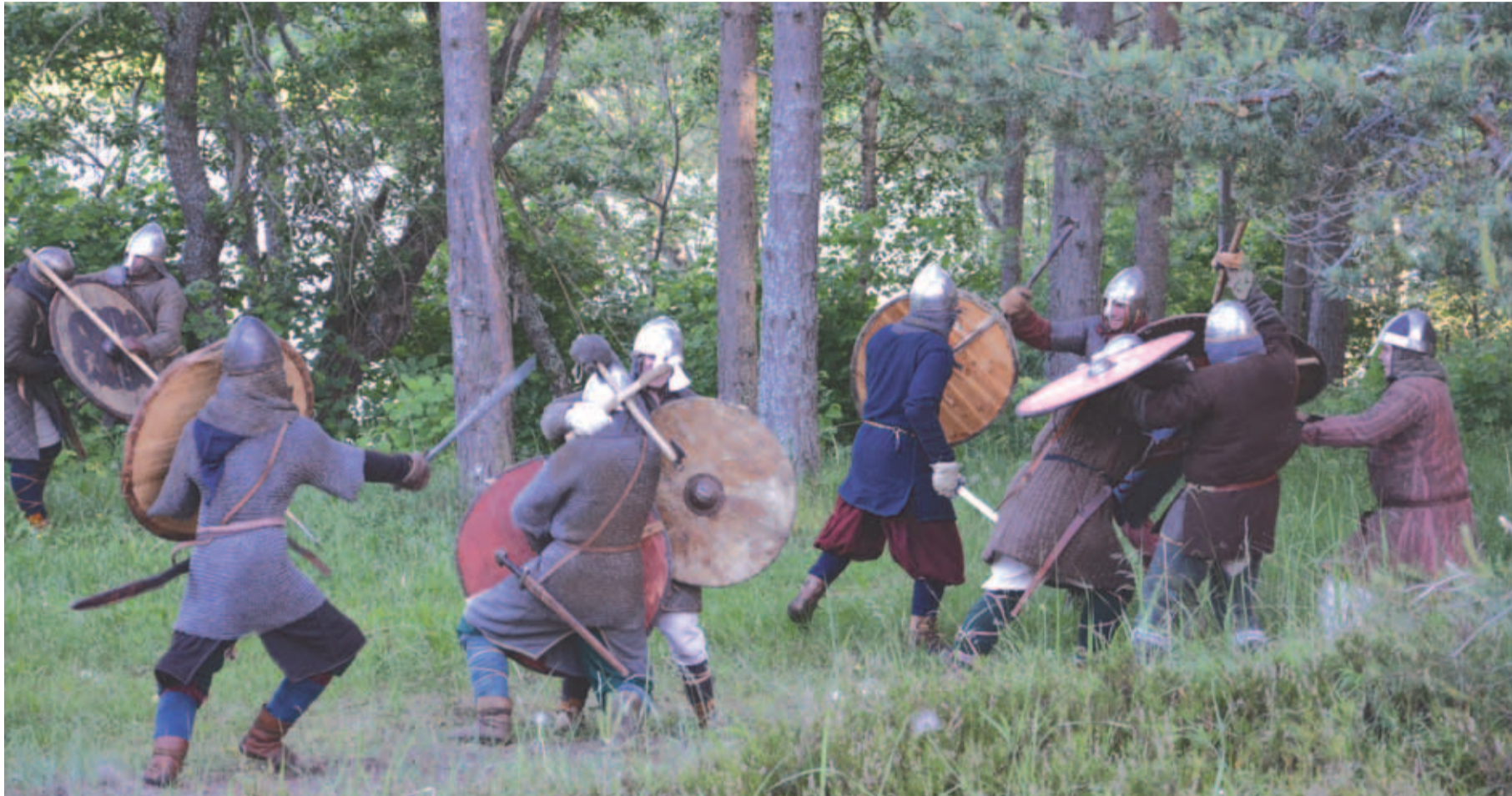
Viikingid pöörasid omavahel tülli.