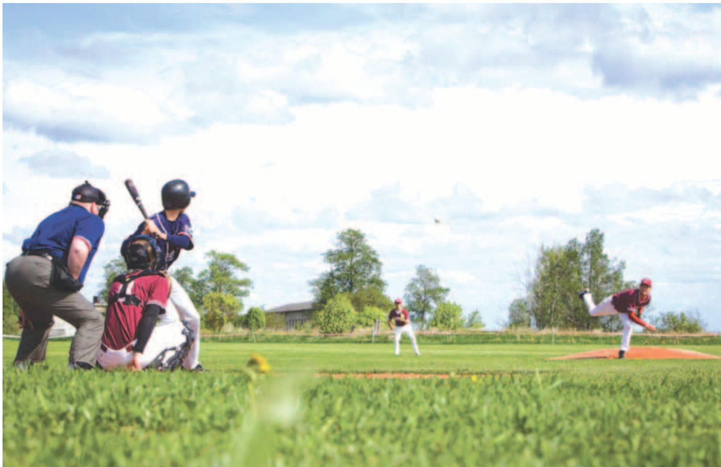
Leedulaste mängumasin töötas täistuuridel.

Kikase liharoogade kõrvale sobivad hästi toorsalatid näieks tomati-mozarella salat ja nii punane kui valge vein."